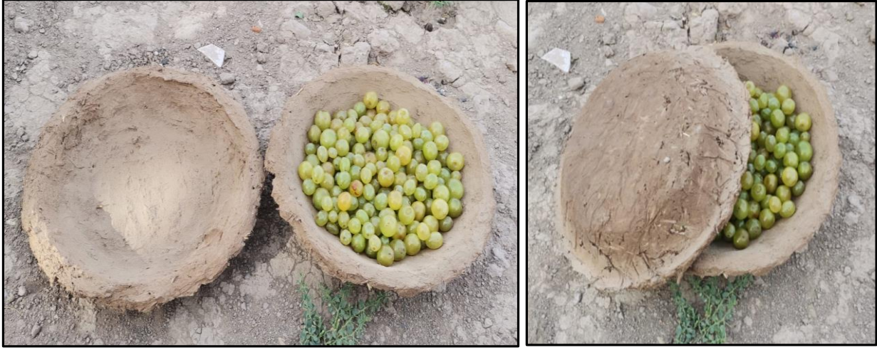
Fotoğraf 6. İçerisine Taze Üzümlerin Konduğu Mühürlenmek Üzere Hazırlanmış Kangina

gören kanginalar yörede geleneksel bir ikramlık olarak da tercih edilmektedir. Kanginalar genellikle üretildikleri yerlerde pazar oluşturmakta, vilayetler arası kangina ticareti pek söz konusu olmamaktadır.