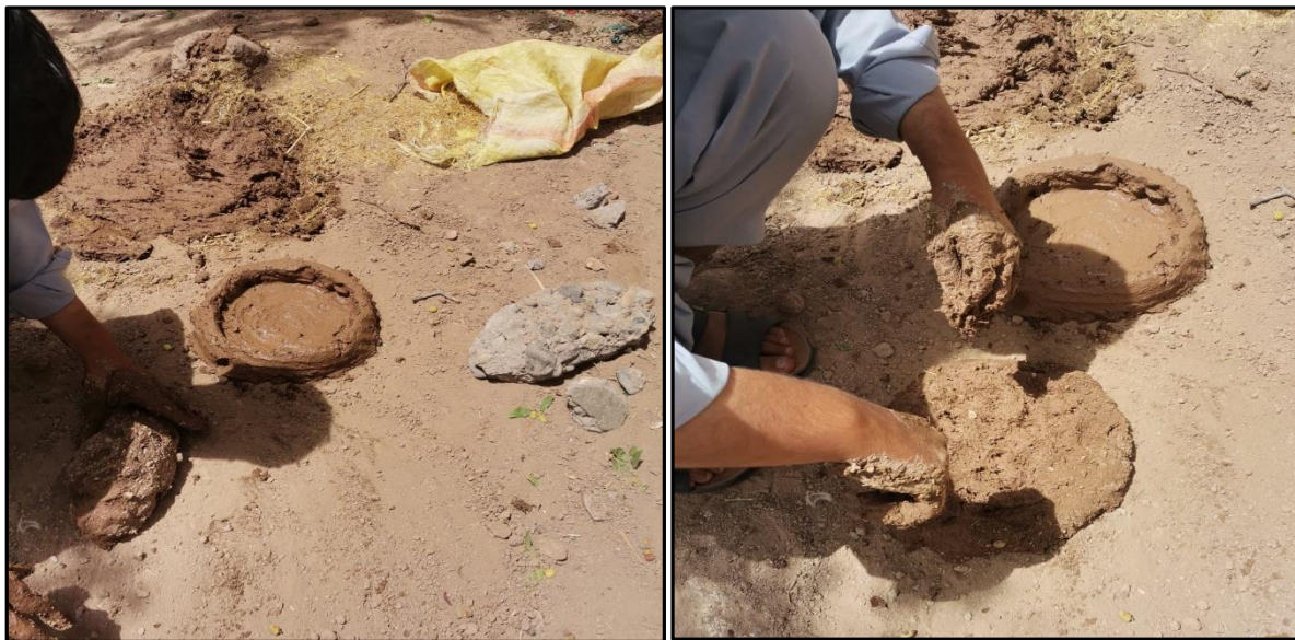
Fotoğraf 3. Kangina Tabakları İçin Killi Toprak ve Samanın Karıştırılarak Bir Harç Elde Edilmesi Aşamalarından Görünümler