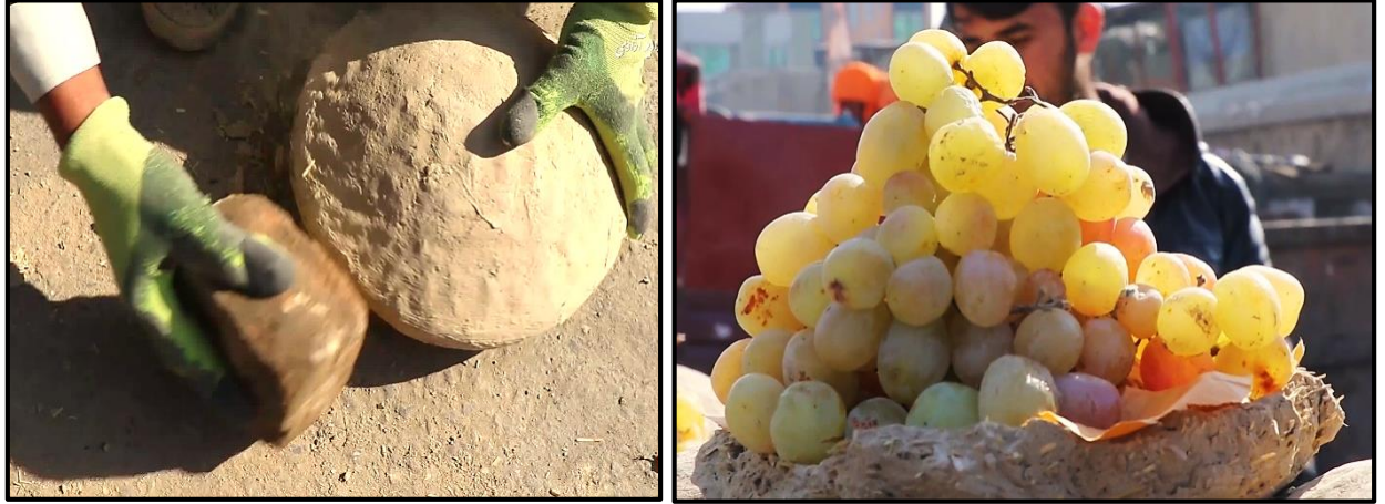
Fotoğraf 8. Mühür Yerlerinden Sert Bir Cisimle Vurularak Açılan Kangina ve Hâlâ Tazeliğini Koruyan Tayfi Üzümlü 1