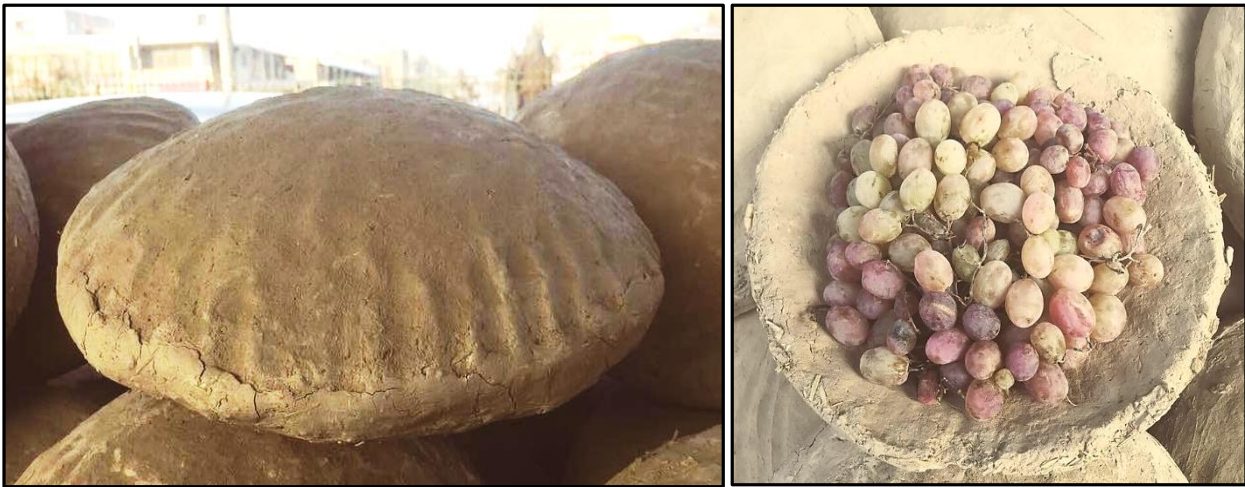
Fotoğraf 7. İdeal Bir Şekilde Mühürlenmiş Kangina ve Sezonunda Açılmış Kangina İçerisindeki Üzümler

Kanginanın Afganistan'daki yapıldığı yerlere baktığımızda geçmişten beri ülkenin kuzeyinde sürdürülen bir faaliyet olduğunu söyleyebiliriz. Özellikle komşu vilayetler olan Belh, Samangan, Sari Pul (Özellikle Sañçarak ilçesinde), Faryab ve Bedahşan'da hala yaygın olan kangina yapımı Kabil'in özellikle kuzey ilçelerinde de (İstelif/Estalif, Kalakan gibi) yapılmaktadır. Ülkenin kuzeyinde ekseriyetle Tacikler, Hazaralar ve Türkler yaşamakla beraber ustalarla yapılan görüşmelerden elde edildiği kadarıyla kangina yapımı belli bir etnik kimliğin ürünü değildir. Ayrıca ülkede bağcılık faaliyetlerinin sürdürüldüğü her yerde kangina yapılmış düşüncesi de yanlıştır. Zira Herat başta olmak üzere bağcılığın yaygın olduğu çoğu vilayette kangina tekniği uygulanmamakta ya da bilinmemektedir. Afganistan'da faaliyetin imalat aşamasına çoğu kırsal kesim etkinliğinde olduğu gibi kanginalar için de kadınlar işgücüne dahil olmaktadır. Özellikle de hazırlanan toprak kaplara seçilmiş üzümlerin yerleştirilmesi ve kanginaların istiflenmesinde kadınlar faal olarak destek vermektedirler.