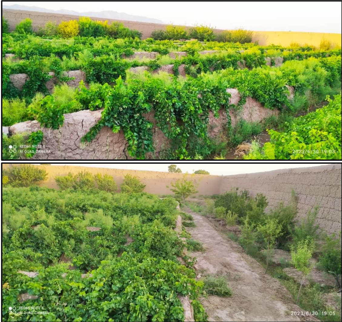
Fotoğraf 2. Afganistan / Herat'taki Toprak Setler ile Oluşturulan Bağlardan Görünümler (Herat Vilayeti – İncil İlçesi – Caye Nukra Köyü / Kışmış Üzümü Bağı)

Kandehar vilayetinde; Argandab, Pençvayi ve Dand'da, Herat ilinde; Ghozereh, İncil, Paştun Zargun, Ubeh'de, Pervan vilayetinde; Çarikar ve Cebel Sirac, Kabil'de; Mir Baça Kot, Karabağ, İstalif, Kalakan, Şakar Dara, Logar vilayetinde; Charkh, Zabul vilayetinde; Kalat, Shahjoy, Gazni vilayetinde; Mokar, Karabağ, Belh vilayetinde; Devletabad, Şolgara ilçeleri ve Tashqarghan (Taşgorghan) bölgesinde, Faryab vilayetinde; Keysar, Peştun Kot, Khaja Sabzepush, Almar, Şirin Tagab ilçelerinde, Tahar vilayetinde; Rustak ilçesi önde gelen bağcılık alanlarıdır.