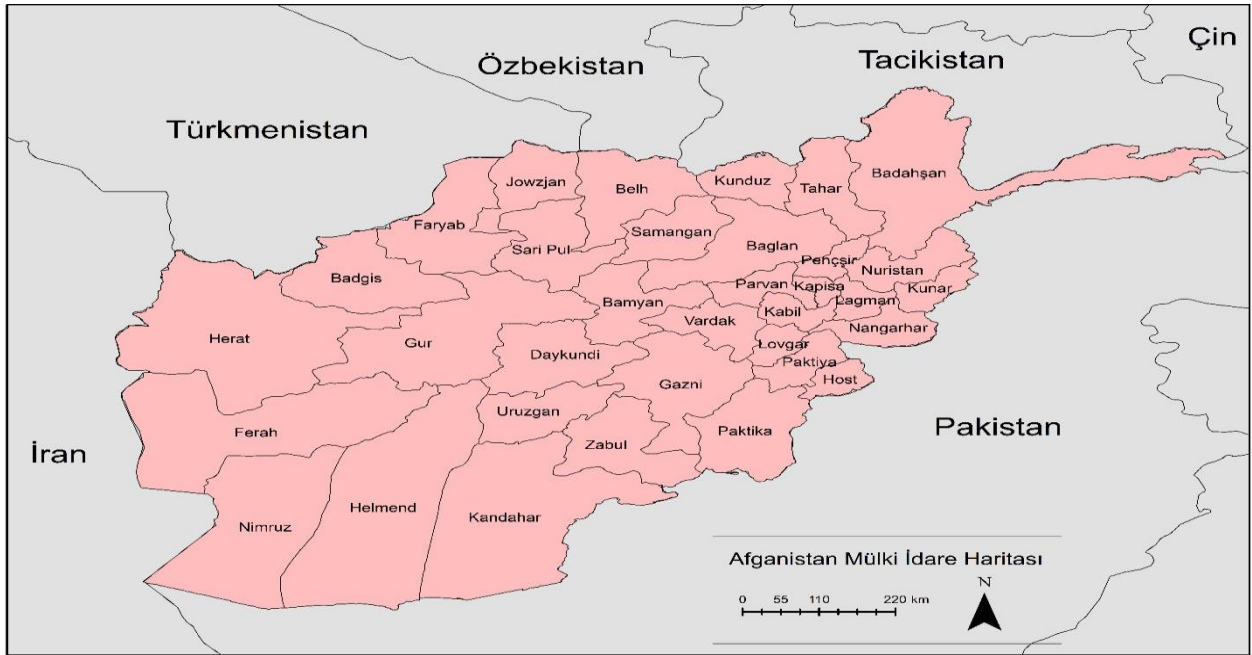
Şekil 1. Afganistan'ın Günümüz İdari Taksimatı

Afganistan, Orta Asya ve Güney Asya'ya yayılan bir ülke olup konumu itibariyle deniz – okyanuslara kıyısı bulunmayan bir ülkedir. Günümüzde 34 vilayeti bulunan ülke, her biri merkezi hükümet tarafından atanan bir vali ile idare edilmektedir (Şekil 1). Ülkenin bir bölümü de Güney Türkistan'ı kapsamakta olup kayda değer bir Türk nüfusu barındırmaktadır. Yüzölçümü 652.864 km 2 olan ülke coğrafi bakımdan üç bölgeye ayrılmaktadır. Ülke jeomorfolojisinin en belirgin elemanı aynı zamanda da Afganistan coğrafyası ile buna bağlı sosyo-ekonomik hayatını şekillendiren eleman şüphesiz Hindikuş Dağları'dır. Himalayaların batı silsilesini oluşturan Hindikuş Dağları, kabaca ülkeyi merkezi kesimden başlayarak güneybatı – kuzeydoğu doğrultulu kat eden, ülke içerisinde yaklaşık 650 km. uzunluğunda bir duvar gibi uzanmaktadır (Toplamda 800 km. uzunluğundadır). Hindikuş Dağları, ülkeyi daha öncede bahsedilen üç coğrafi bölgeye ayırır. Bunlar; Merkezi Dağlık Bölge, Güney Plato Sahası ve Kuzey Ovalık Bölgesi'dir (Yousufi, 2016: 36). Anlaşılabacağı üzere ülkenin asıl tarım merkezi kuzeydeki ovalık saha olup zirai faaliyet çeşitliliği ve üretim potansiyeli burada bulunmaktadır. Buranın Ceyhun – Amuderya ve kolları tarafından da sulanan bir alan olması da zirai potansiyelini artırmaktadır.