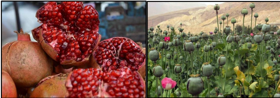
Fotoğraf 1. Afganistan Tarım Hayatında Öne Çıkan Ürünlerden Nar ve Haşhaş

Ülkenin 38.356.000 ha.'lık tarım arazisinin çok büyük bir kısmı (%79'u) çayır-mera alanlarından oluşmakta ve sadece 8 milyon hektarlık kısmı bitkisel üretim açısından değerlendirilebilmektedir. Söz konusu bu 8.094.000 ha.'lık alanın da 2021 yılı itibariyle toplam tarım arazisinin 2.164.537 hektarı (%26,7'si) tahıllara ayrılmıştır (Tablo 1). Sırasıyla ülkede en fazla üretilen tahıllar ise buğday (1.833.357 ha.), çeltik (152.499 ha.) ve mısır (92.144 ha.) olup sınırlı miktarda arpa ve darı yetiştiriciliği de yapılmaktadır (FAO, 2023). Tahılları 351.694 ha. alanla meyveler takip etmektedir ki çalışma öznemiz olan kanginalarda saklanan üzümler de bu grupta yer aldığından konu ilerleyen bölümde daha detaylı ele alınmıştır. Ülkede diğer tarım ürünleri çok daha sınırlı alanlarda yetiştirilmekte olup sırasıyla sebzeler, yağlı tohumlar, baklagiller gelmekte ve çok daha sınırlı alanlarda lif bitkileri, yumru bitkiler ile şeker bitkileri yetiştirilmektedir. Elbette Afganistan tarımından bahsederken akla gelen ilk ürünlerden biri de haşhaştır. Uluslararası arenada oldukça tepki gören bu zirai faaliyeti sınırlandırmak adına son yıllarda haşhaş alanlarında safran yetiştiriciliğine yönelmeler artmaktadır (Şahin, 2021: 192).